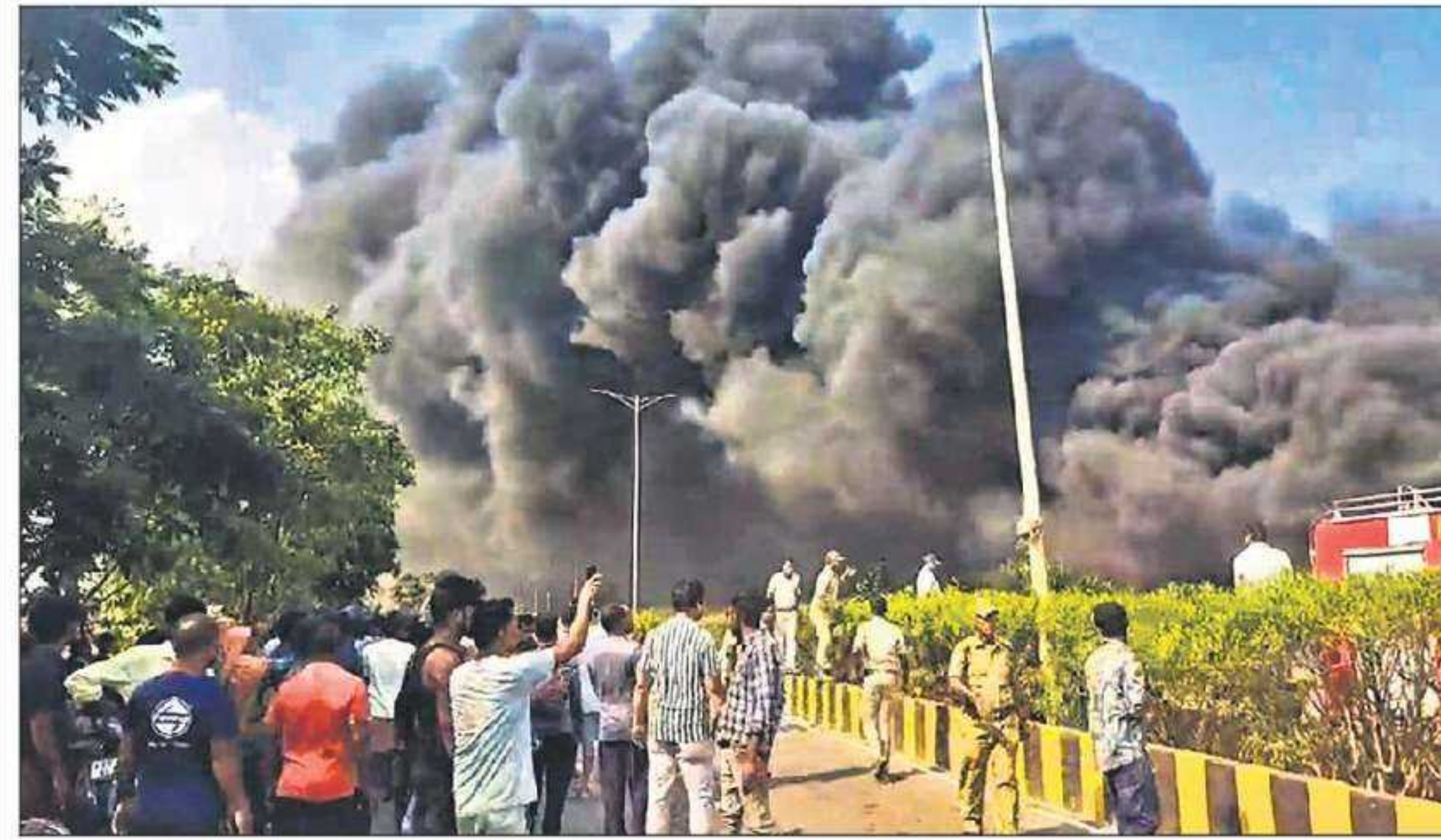
Smoke billows after a massive fire in the pipe stockyard in the Indian Oil Corporation Limited's premises in Jagatsinghpur district of Odisha on Monday.